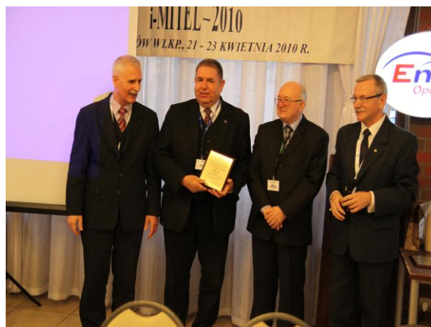
Wyróżnienie Instytutu Energetycznego ZD w Białymstoku