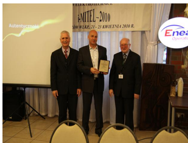
Wyróżnienie firmy BEZPOL