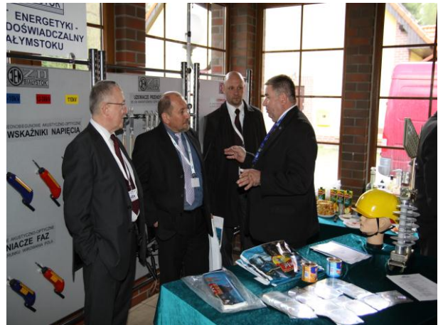
Dyskusje przy stoisku IE ZD w Białymstoku