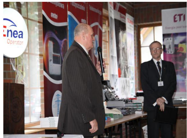
Wystąpienie v-ce Wojewody Lubuskiego Jana Świrępo