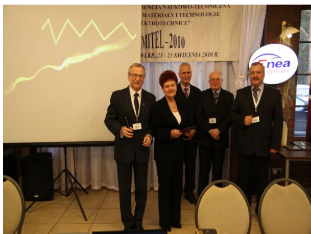
Wyróżnienie Firmy GALMAR