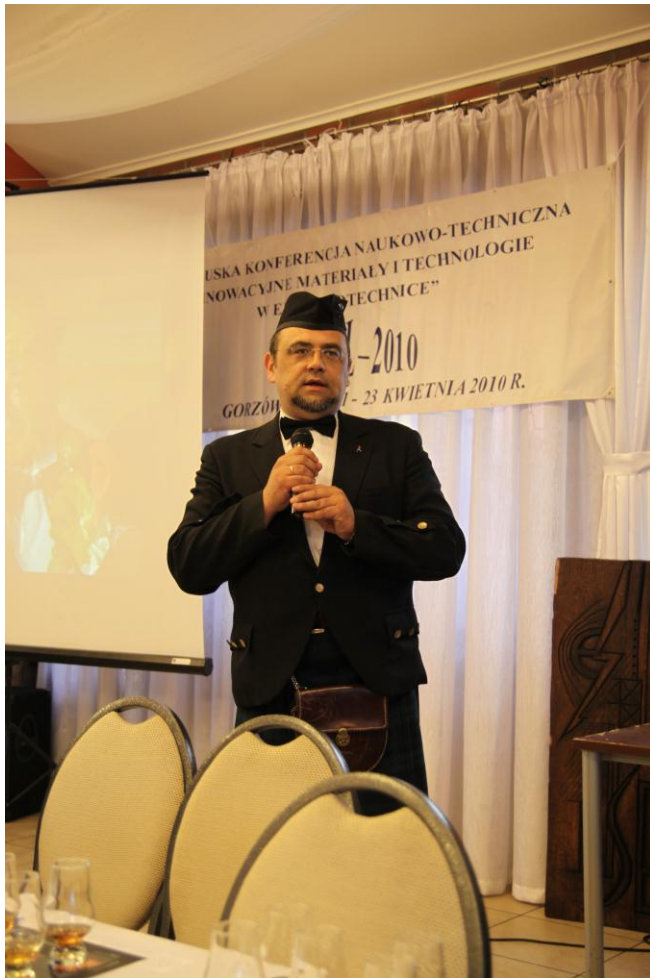
W części artystycznej wystąpił ambasador whisky JW