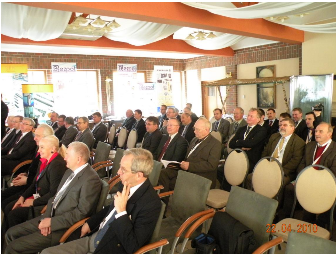
Uczestnicy Konferencji i-MITEL 2010