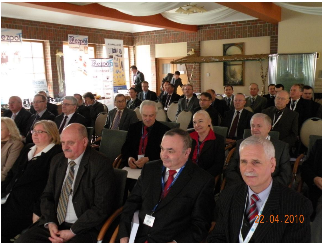
Uczestnicy Konferencji i-MITEL 2010