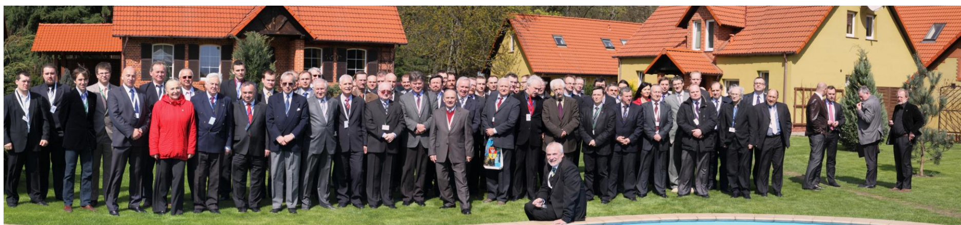
Uczestnicy Konferencji i-MITEL 2010