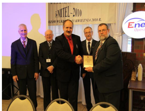
Wyróżnienie firmy DEHN Polska