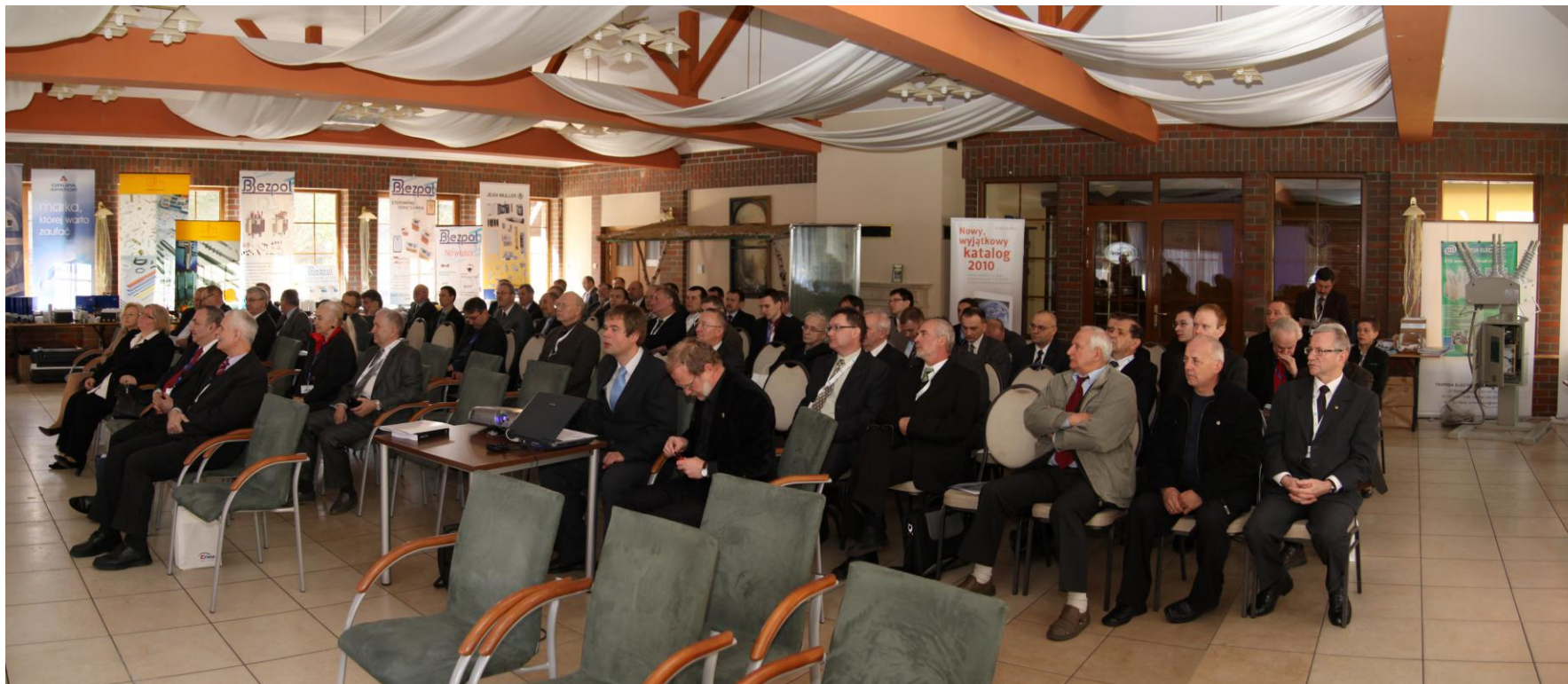
Uczestnicy Konferencji i-MITEL 2010