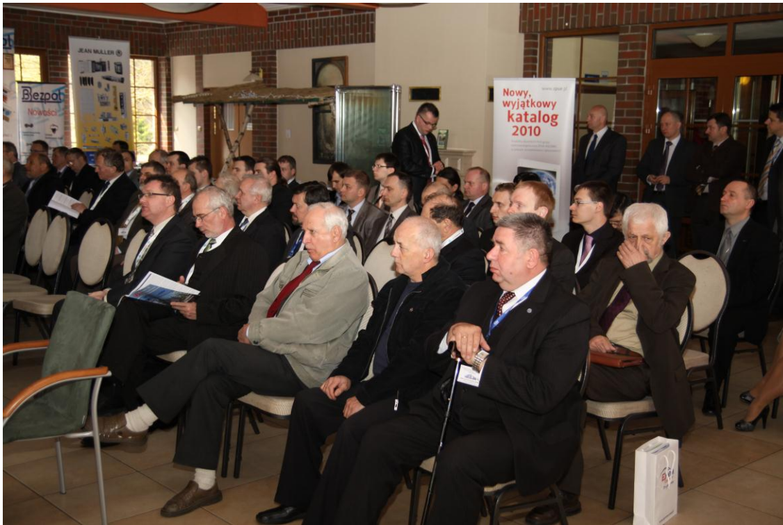
Uczestnicy Konferencji i-MITEL 2010