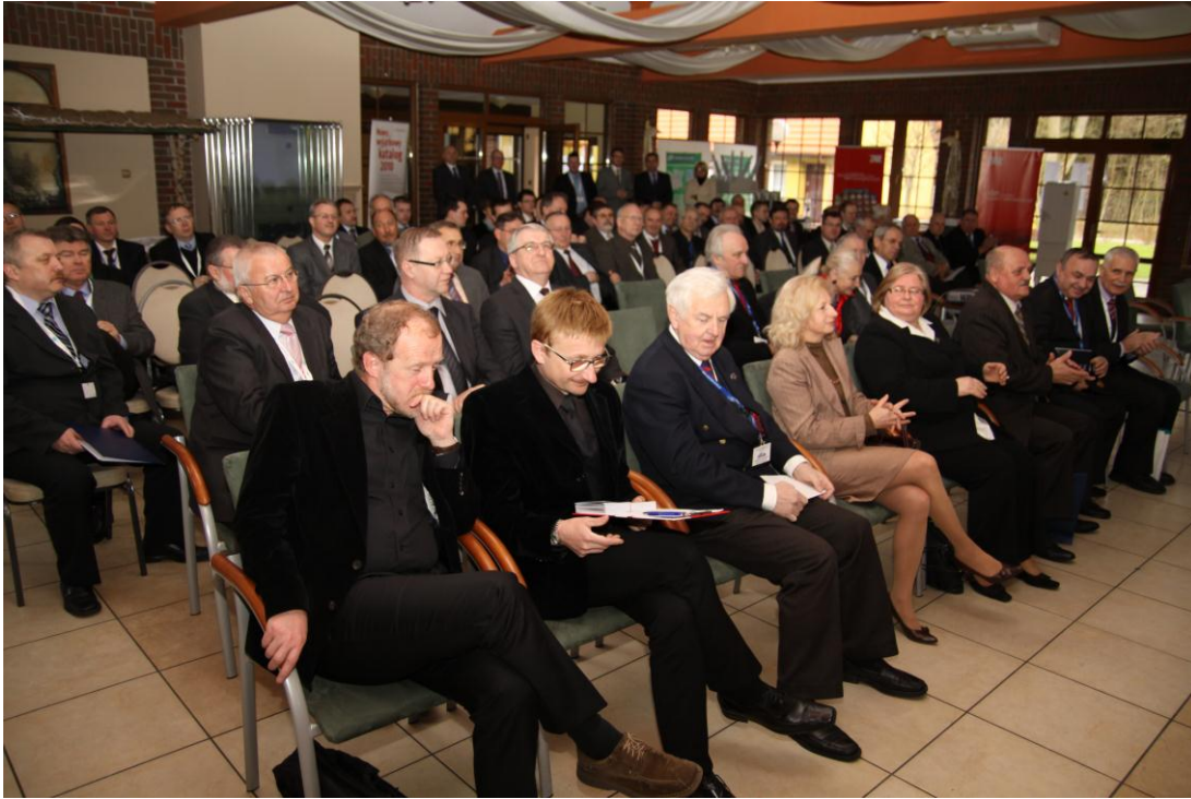
Uczestnicy Konferencji i-MITEL 2010